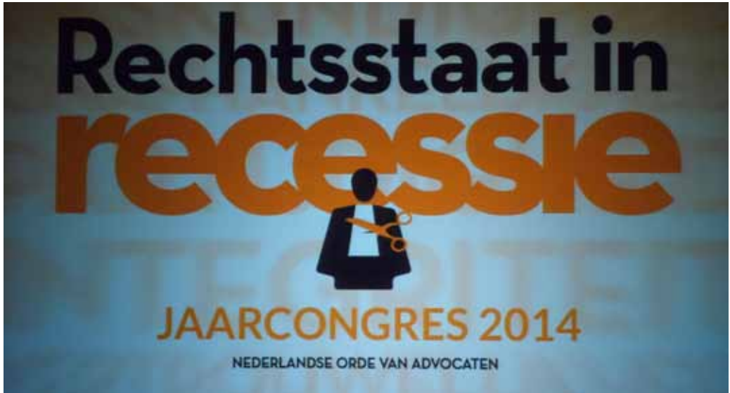
Jaarcongres Rechtsstaat in recessie