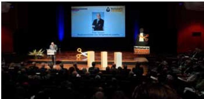
De rede van Fred Teeven, staatssecretaris van het Ministerie van Justitie