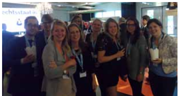
De Gelderse Jonge Balie is uiteraard van de partij op de borrel na afloop van het congres