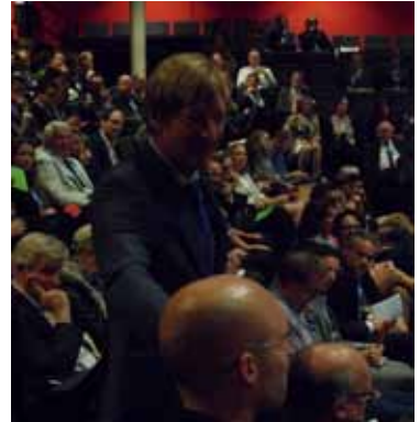
Interactie met de zaal