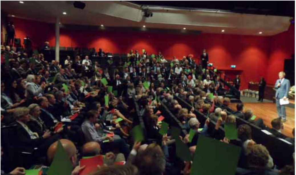
Stemmen op de stellingen van de debaters