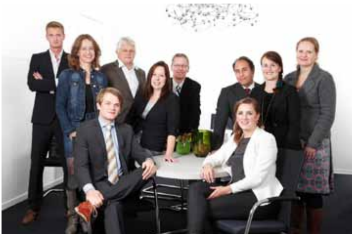
'Het team' Geurink & Partners

"Zoals op onze website is te lezen, heb ik inderdaad in Nijmegen gestudeerd. Ik heb overigens eerst een jaar in Groningen gestudeerd en heb de rest van mijn studie afgemaakt in Nijmegen. Ik vond Groningen een ontzettend leuke en gezellige stad, maar wel erg ver weg van de rest van Nederland. Nijmegen ligt veel centraler. Ik heb een master staat- en bestuursrecht gedaan."