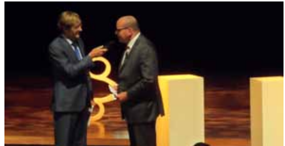
Ferry Mingelen interviewt Fred Teeven, staatssecretaris van het Ministerie van Justitie